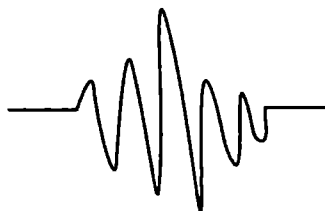
Pacote de onda

Podemos fazer duas perguntas a respeito da partícula nesse pacote de onda: (1) Onde está ela e (2) qual é o momento dela? Os físicos descobriram que podemos fazer uma dessas perguntas, mas não as duas. Por exemplo, uma vez que você pergunte: